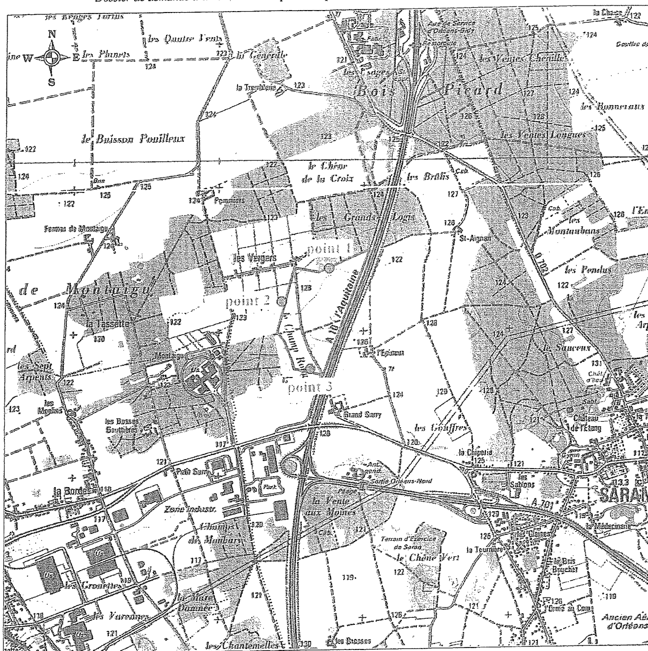
Figure 1 : localisation des points de contrôle des niveaux sonores